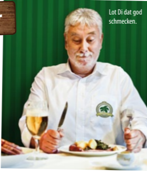
Lot Di dat god schmecken.