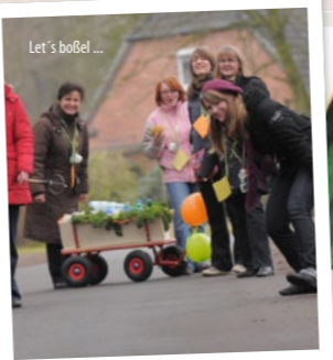
Let's boBel ...

Grün ist die Farbe der Saison: Kohlsmutje Kochschürze für drüber, Boxershorts „Oldenburger Palme“ für drunter, Fahrradklingeln, Frühstücksbrettchen, Kühlschrank-Magnete, Tassen oder Schlüsselanhänger, ganz viel Grünkohlessen und Grünkohlpakete mit leckeren Zutaten zum Selberkochen – das alles wartet auf Sie nach Absolvierung des 2. Semesters.