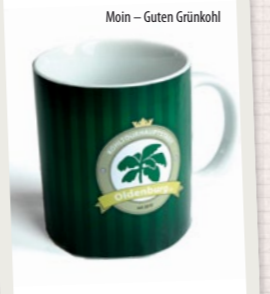
Moin – Guten Grünkohl

Was dem Berliner sein Bär, ist dem Oldenburger der Grünkohl: Das inoffizielle Wappengemüse der Kohltourhauptstadt Oldenburg. Mit dem Fanpaket aus Tasse, Schlüsselanhänger, Frühstücksbrettchen und Pinnchen machen Sie nach dem 1. Semester nicht nur in der Bundeshauptstadt eine gute Figur.