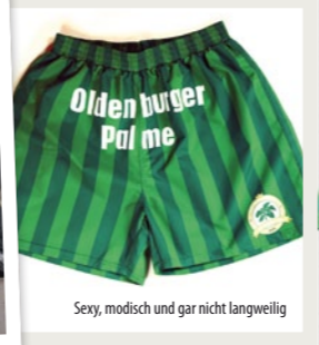
Sexy, modisch und gar nicht langweilig